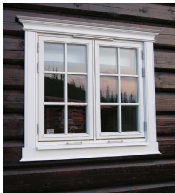
7 ulike modeller for vindu å velge i