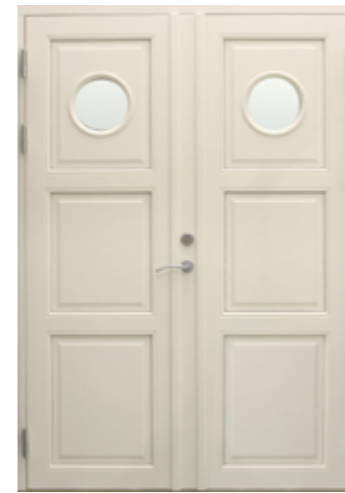
To-fløyet speildør eksklusiv