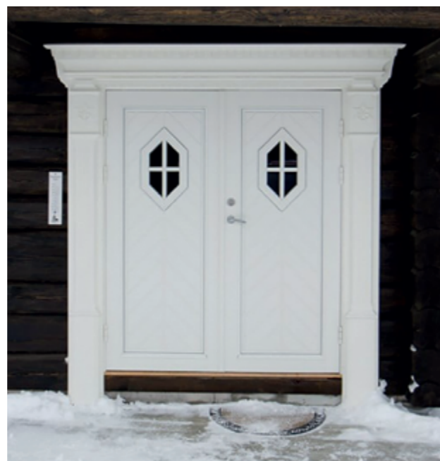
2 ulike modeller for dør å velge i.