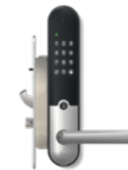
Yale Doorman L3S