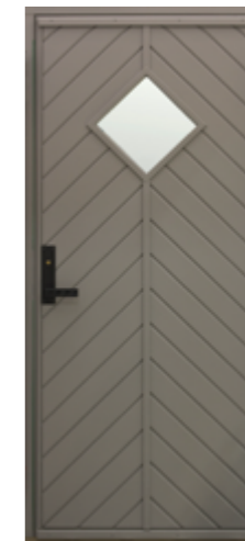
Paneldør eksklusiv i accoya